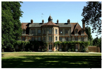
Château de la Petite Haye