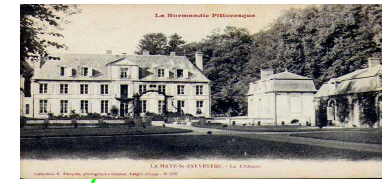
Schloss von La Grande Haye